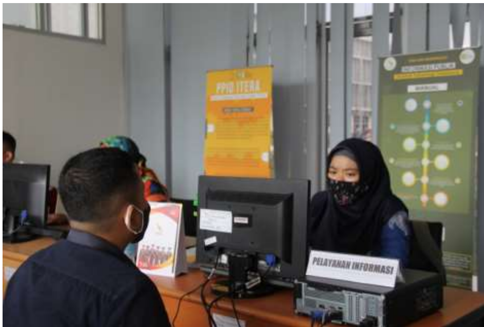
Gambar 4. Foto Ruang Pelayanan Informasi di ITERA

Pada Pusat Pelayanan Informasi Publik ini, masyarakat bias mengajukan permohonan informasi publik atau mengajukan keberatan atas permohonan informasi publik. Setiap hari nya, ada dua staf yang ditugaskan untuk melayani pemohon informasi. Sebagian besar masyarakat datang menjelang penerimaan mahasiswa baru untuk mencari tahu tentang program studi di ITERA, akreditasi, dan informasi akademik lainnya sehingga langsung dilayani saat itu juga tanpa harus mengajukan permohonan informasi publik.