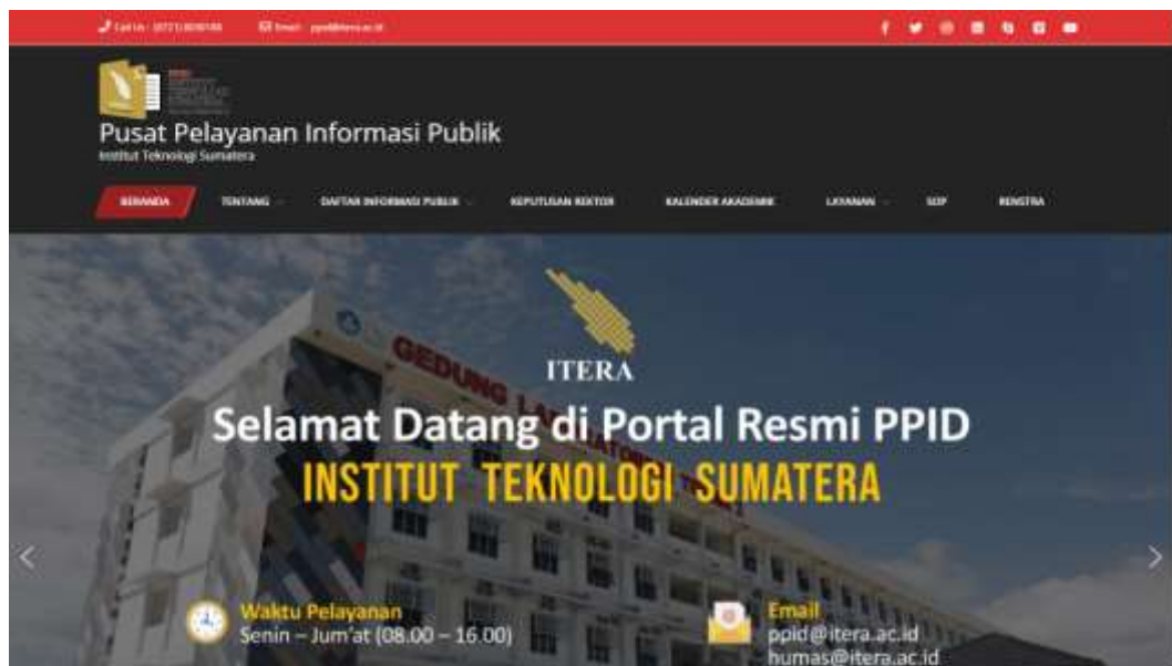
Website resmi PPID ITERA : https://ppid.itera.ac.id/