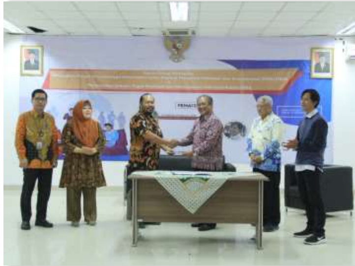
Foto Pembentukan Satgas Publikasi dan Keterbukaan Informasi Publik ITERA